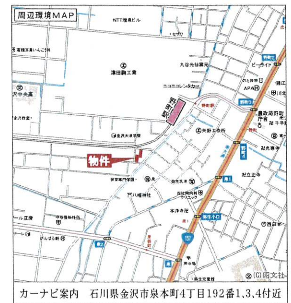
カーナビ案内 石川県金沢市泉本町4丁目192番1,3,4付近